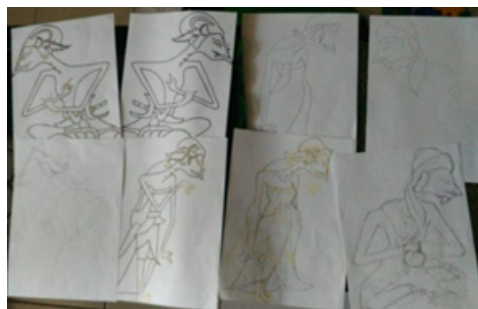
Gambar 4: Sketsa pengembangan model tokoh

Uraian analisa naskah dengan pola diatas akan mempermudah dalam mengkreasikan visual karya secara optimal dan bertanggungjawab. Naskah yang diangkat divisualkan menggunakan gaya visual wayang beber yang khas dengan berbagai perubahan diperlukan sehingga sesuai dengan tokoh yang diinginkan. Demikian pula dengan latarbelakang visual yang digunakan menyesuaikan juga dengan naskah yang diangkat. Berikut sketsa pengembangan model tokoh dengan gaya wayang beber: