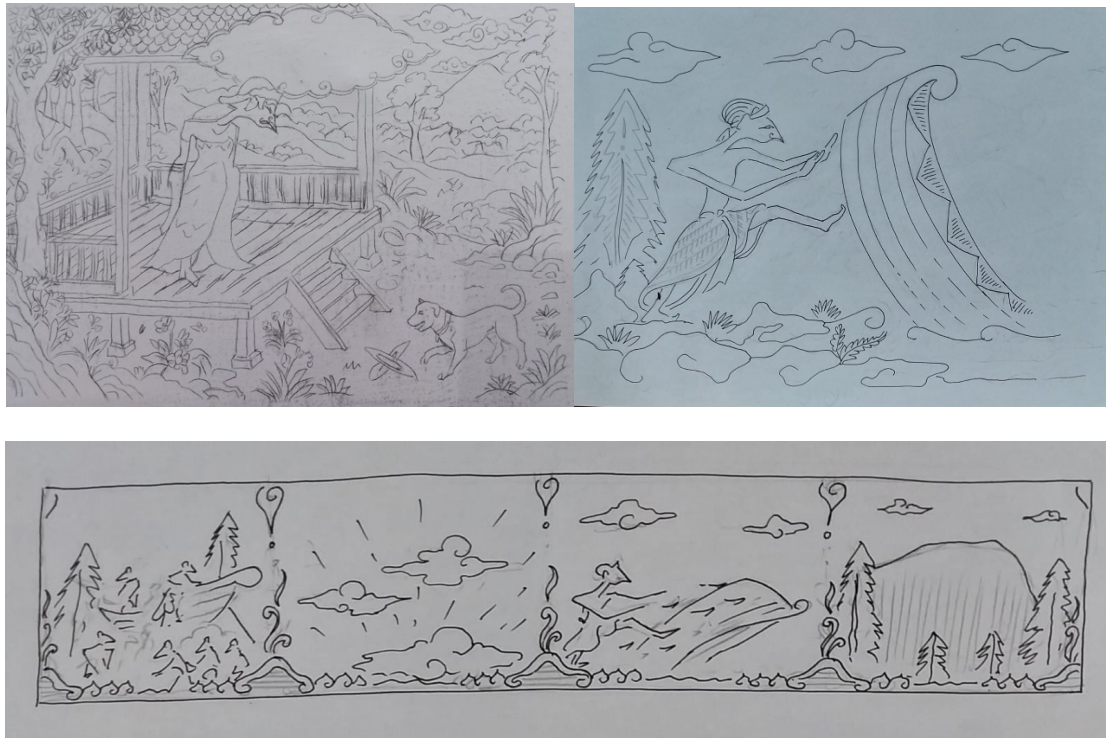
Gambar 5, 6 dan 7. Sketsa Model Tokoh dan Latar Cerita

perahu, berikut aketsa Panjang berisikan babagan saat Sangkuraing dan para jin sedang membuat perahu, saat muncul Cahaya terang dari timur, saat Sangkuriang marah dan menendang perahu dan gambar tampilan gunung tangkupan perahu yang digambarkan pada tiga sketsa berikut: