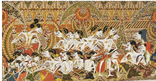
Gambar 3. Wayang Beber

Wayang beber sebagai modal dasar untuk dikembangkan dalam bentuk sufenir sebagai bagian dari cinderamata yang khas destinasi wisata dari Indonesia. Dalam upaya mewujudkan karya tersebut kreativitas berperan penting dalam mengoordinasikan kerja imajinasi. Imajinasi (Tabrani, 2006) adalah mekanisme untuk mengambil kembali imaji yang tersimpan dalam memori, baik dalam bentuk asli maupun kombinasi. Imajinasi sebagai kemampuan menghubungkan atau mengkombinasikan imaji-imaji ke dalam proses berpikir maupun perasaan ( feeling ). Tiga jenis imaji. Pertama, pra-imaji, tidak disadari atau tidak dapat ditangkap sensasi persepsi, tapi dapat dihayati, berguna untuk menghayati keseluruhan situasi. Kedua, imaji konkret, mulai dari gambar pola sampai pada bentuk. Ketiga, imaji abstrak yaitu bahasa (Tabrani, 2005). Bahasa dapat berupa kata atau kalimat yang diungkapkan dalam tulisan (tulisan), kata (tuturan) maupun rupa (gambar). Berikut gambar wayang beber: